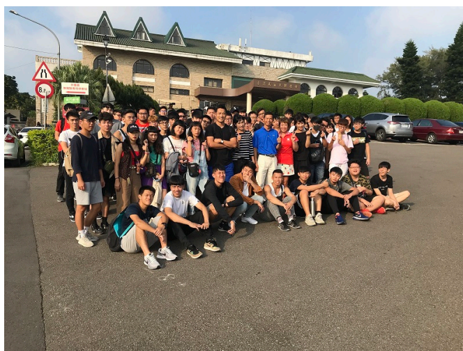
台灣高爾夫俱樂部門口團體合影